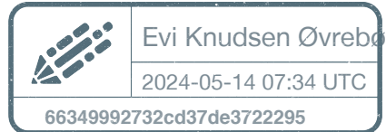
Evi Knudsen Øvrebø